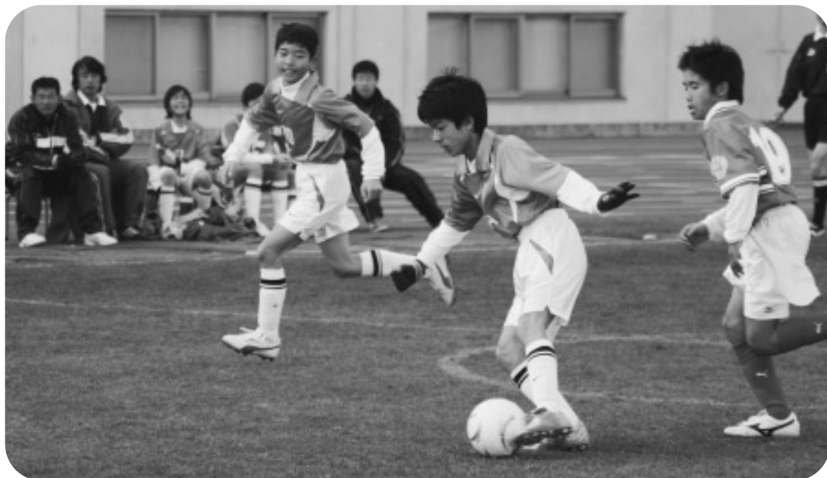
第9回 丸亀競技場フットサル大会（2月12日）