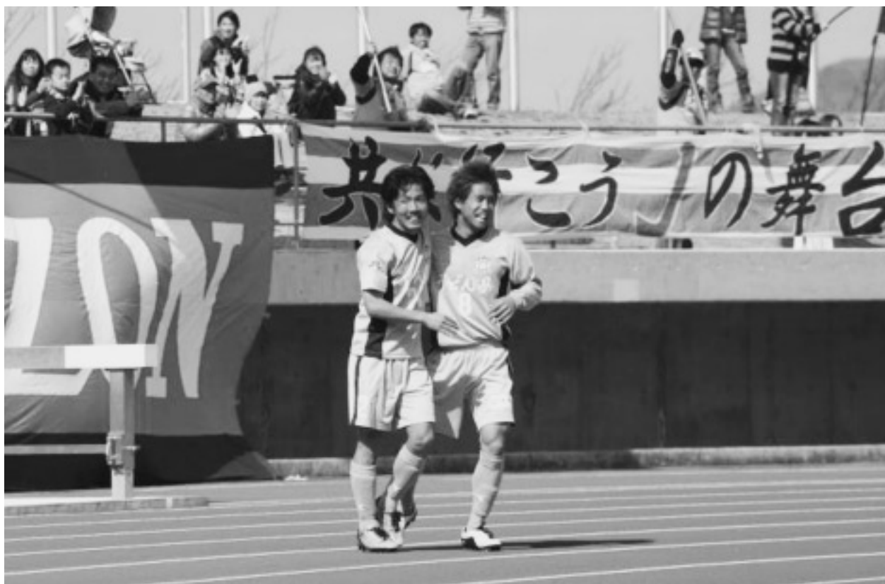
カマタマーレ讃岐