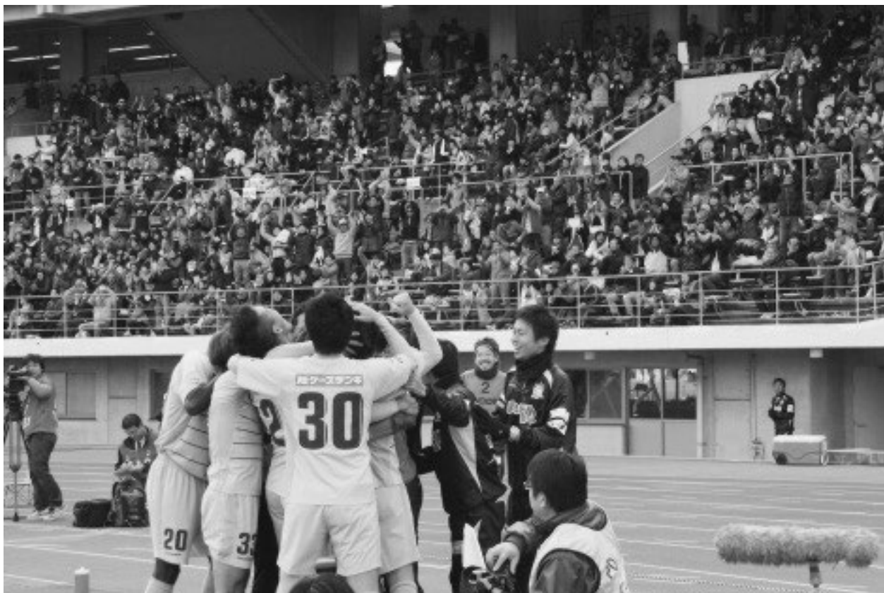
↑VSガイナレ鳥取戦ホームゲームにて先制点を決めた瞬間