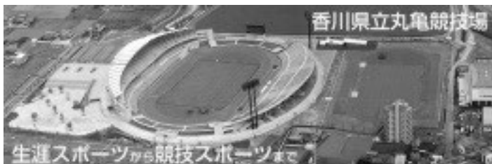
◎丸亀競技場 個人利用料金表(円)◎