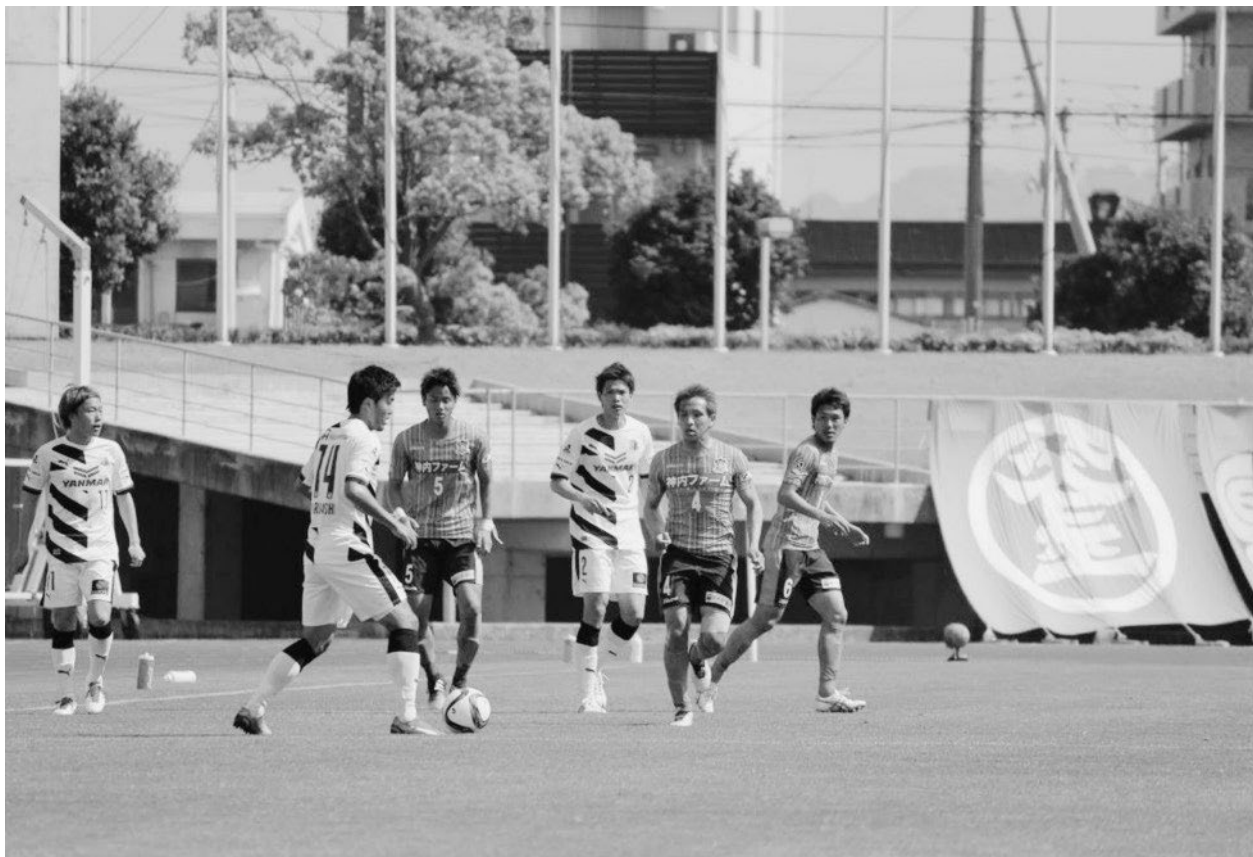
↑ カマタマーレ讃岐 vs セレッソ大阪