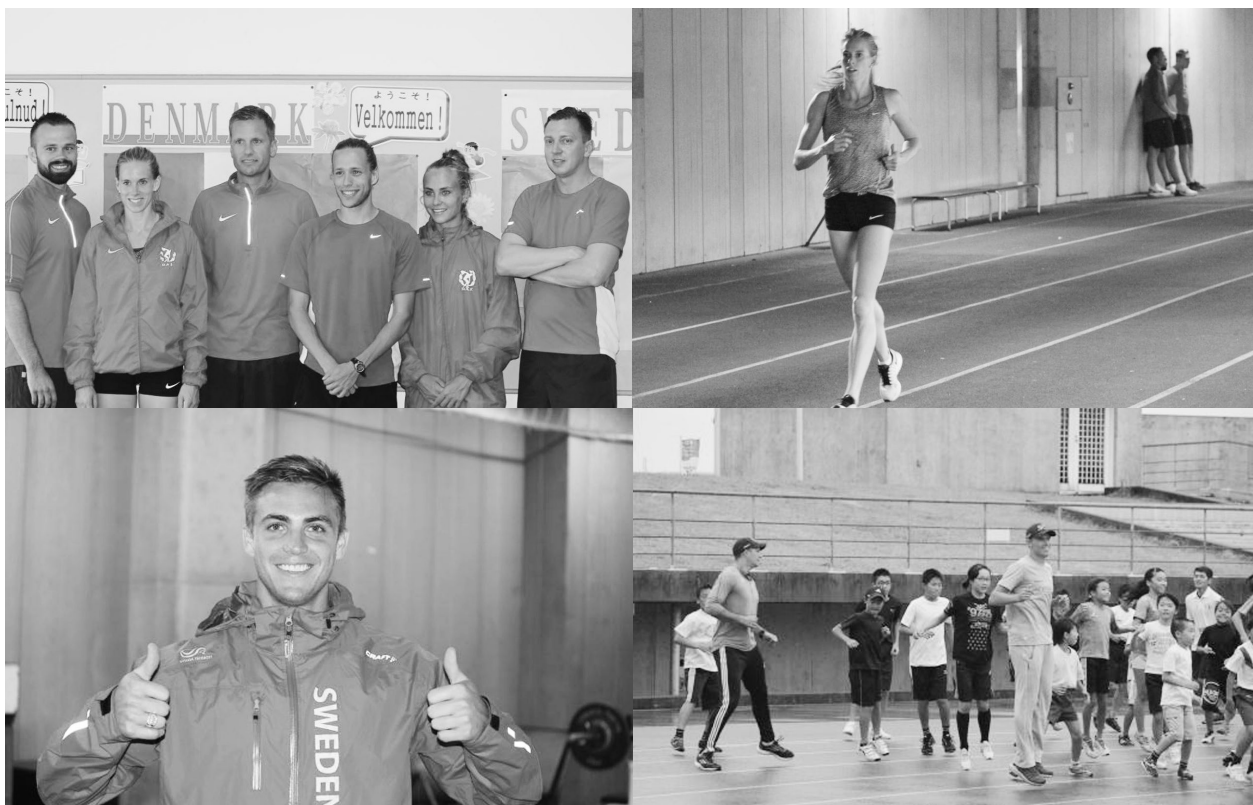
↑ 世界陸上 香川合宿の様子