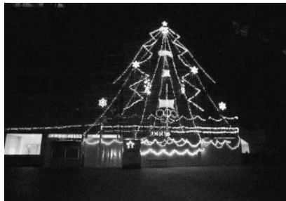
《イルミネーションツリー》