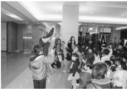
《じゃんけんゲームの様子》

平成27年12月5日（土）にPikaraスタジアムのクリスマスイルミネーションの点灯式を行いました。ツリーライトアップの他にも、お話会や合唱、尽誠学園高校吹奏楽部による演奏会、じゃんけんゲームなど盛りだくさんのイベントとなり、たくさん子どもたちが参加してくれました。最後には、グラウンドを開放し、親子でかけっこをするなど、大いに盛り上がった夜となりました。