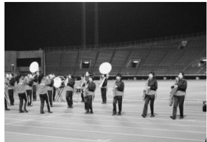
《尽誠学園高校吹奏楽部》