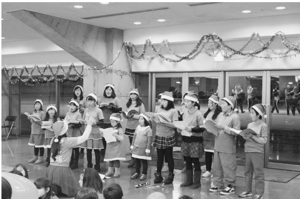
↑ クリスマスイベントの合唱（コーロ・デルクオーレ）