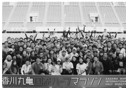
〈ジョギング教室集合写真〉

7日はハーフマラソンが行われました。明け方に降っていた雨も、スタート時にはすっかり晴れて、レースはスタートしました。今年のハーフマラソンの出走者は10173名でした。前日に行われた3kmと小学生駅伝を合わせると、11015名ものランナーが丸亀の地を駆け抜けました。