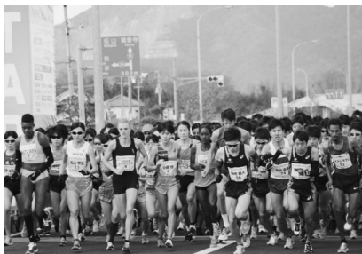
〈ハーフマラソンスタート時〉

また、チャリティーイベントでは、有名選手のサイン入りグッズのオークションも行われ、大変盛り上がりました。