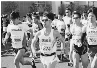
〈ハーフマラソン一般スタート時〉