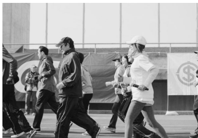
〈ジョギング教室の様子〉