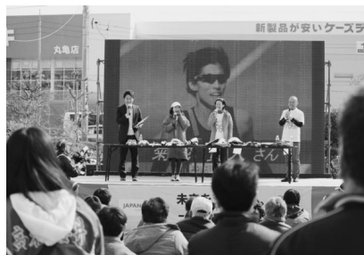
〈チャリティーオークション〉