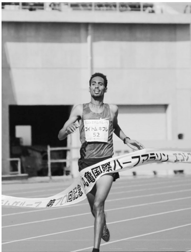
↑男子ハーフマラソン優勝 ゴイトム・キフレ選手