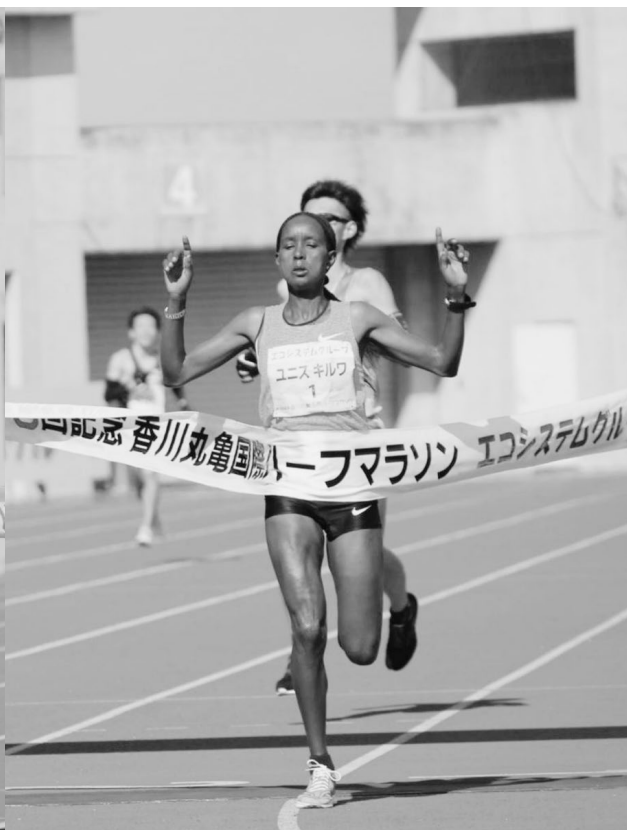
↑女子ハーフマラソン優勝 ユニス・キルワ選手