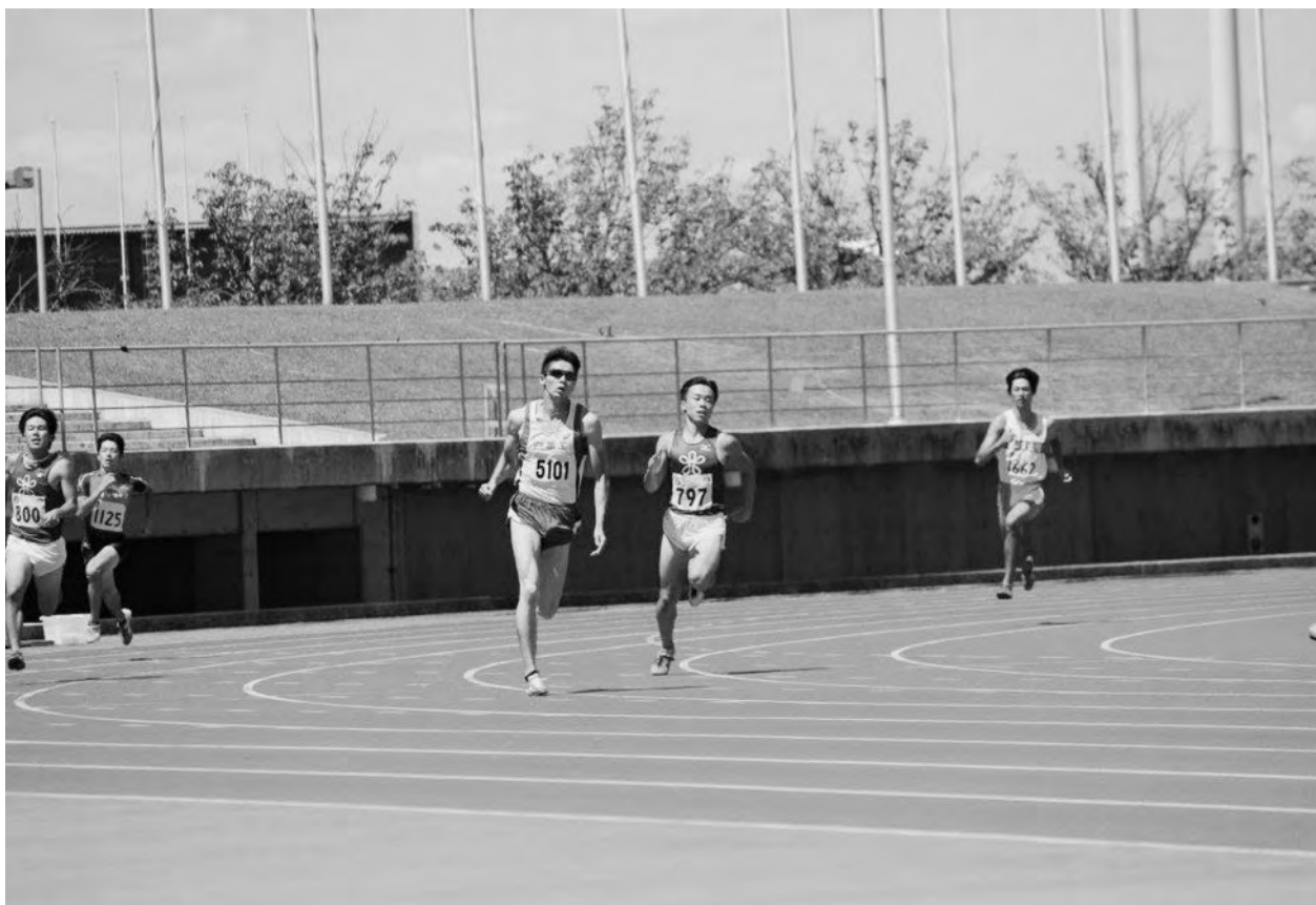
↑ 国体陸上競技香川県最終予選会