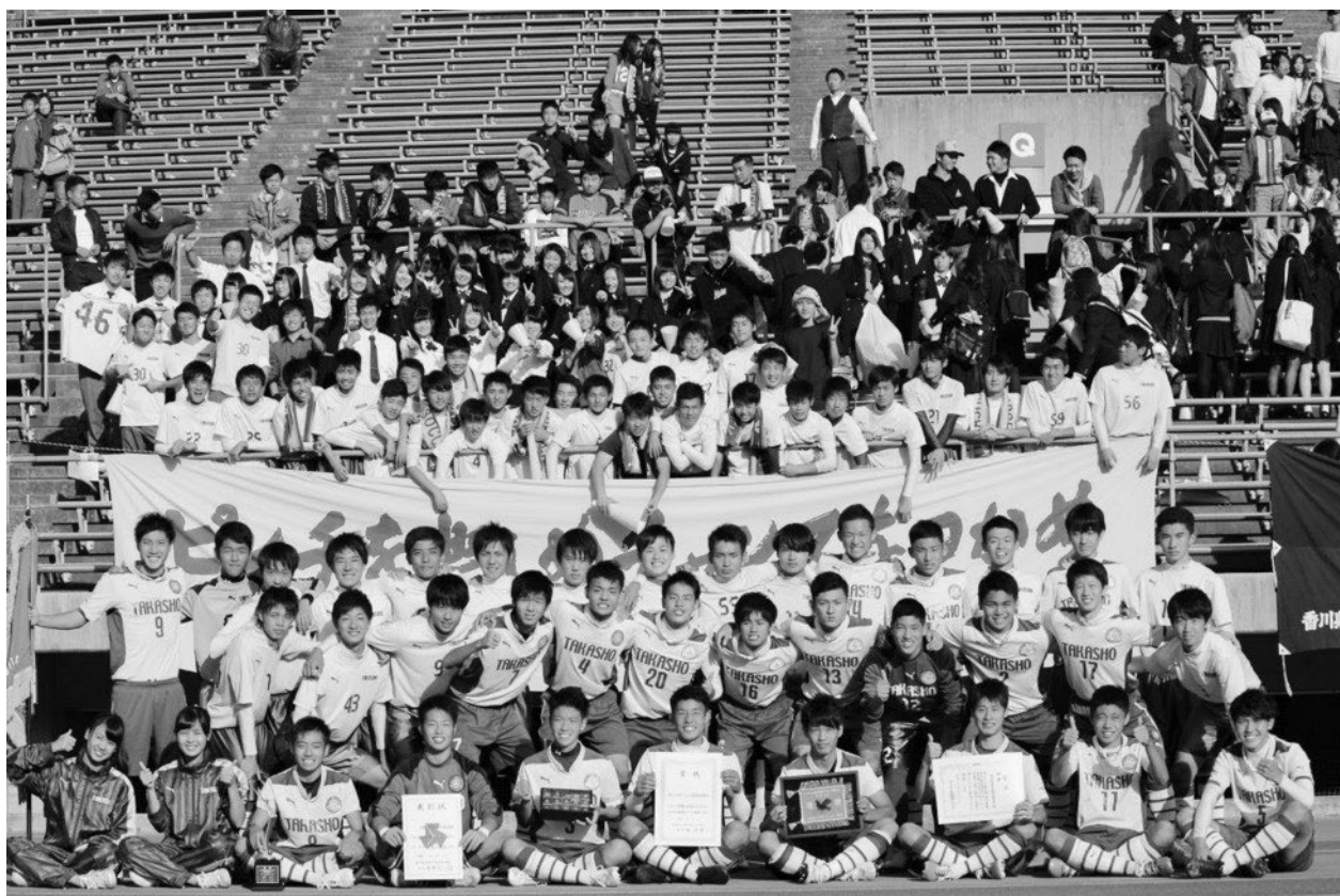
↑ 全国高校サッカー選手権大会香川県代表 高松商業高校