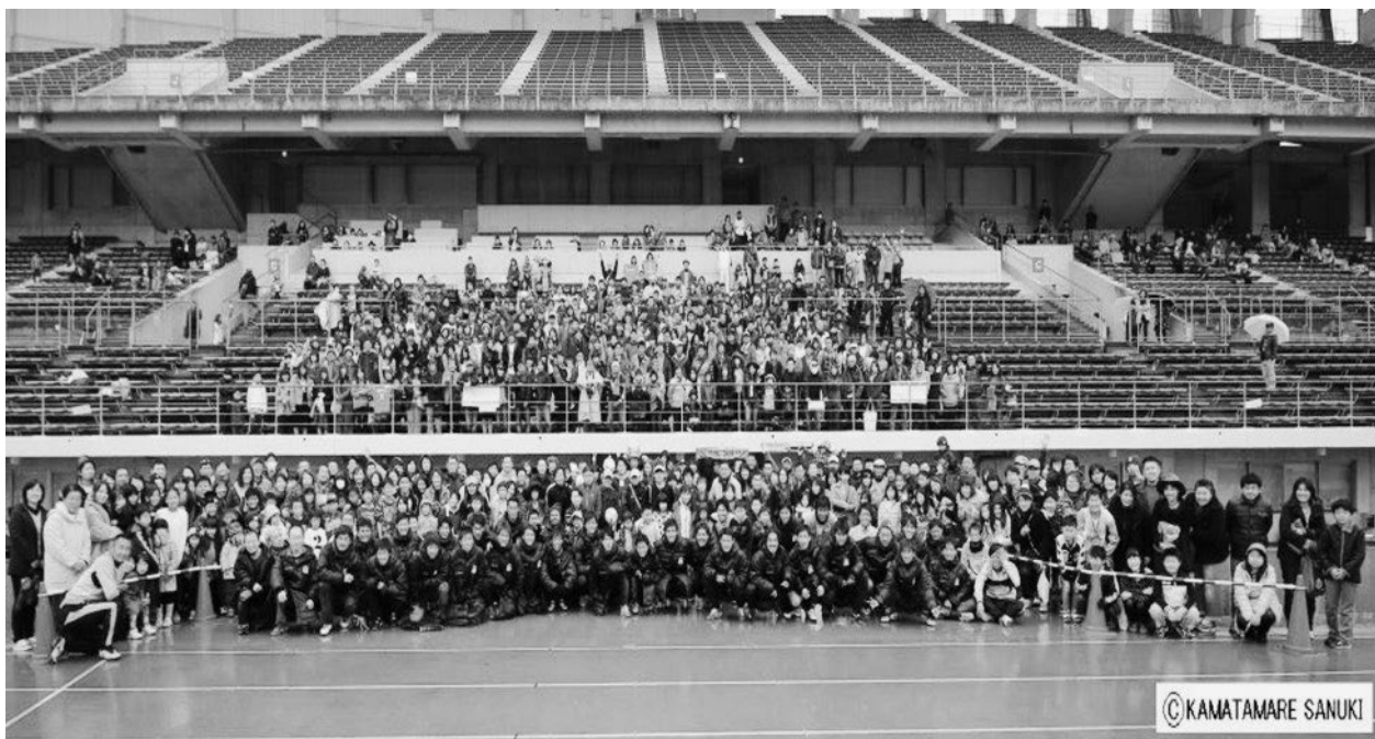
↑カマタマーレ讃岐 集合写真