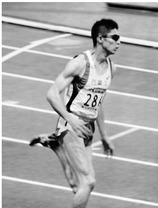
【2017 日本陸上競技選手権大会】

「国際大会出場の経験が出来たのは、よかったと感じている。地元の歓声がすごく、東京五輪のイメージにも繋がった。その五輪に向けてより一層自身を高めていきたい。」と話しました。