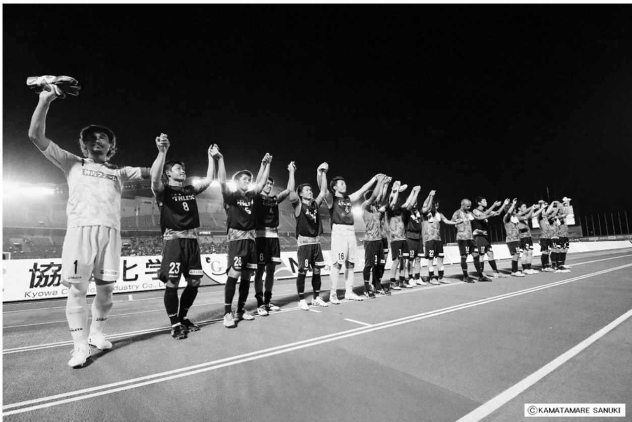
↑カマタマーレ讃岐横浜FC戦 サポーターへの挨拶場面