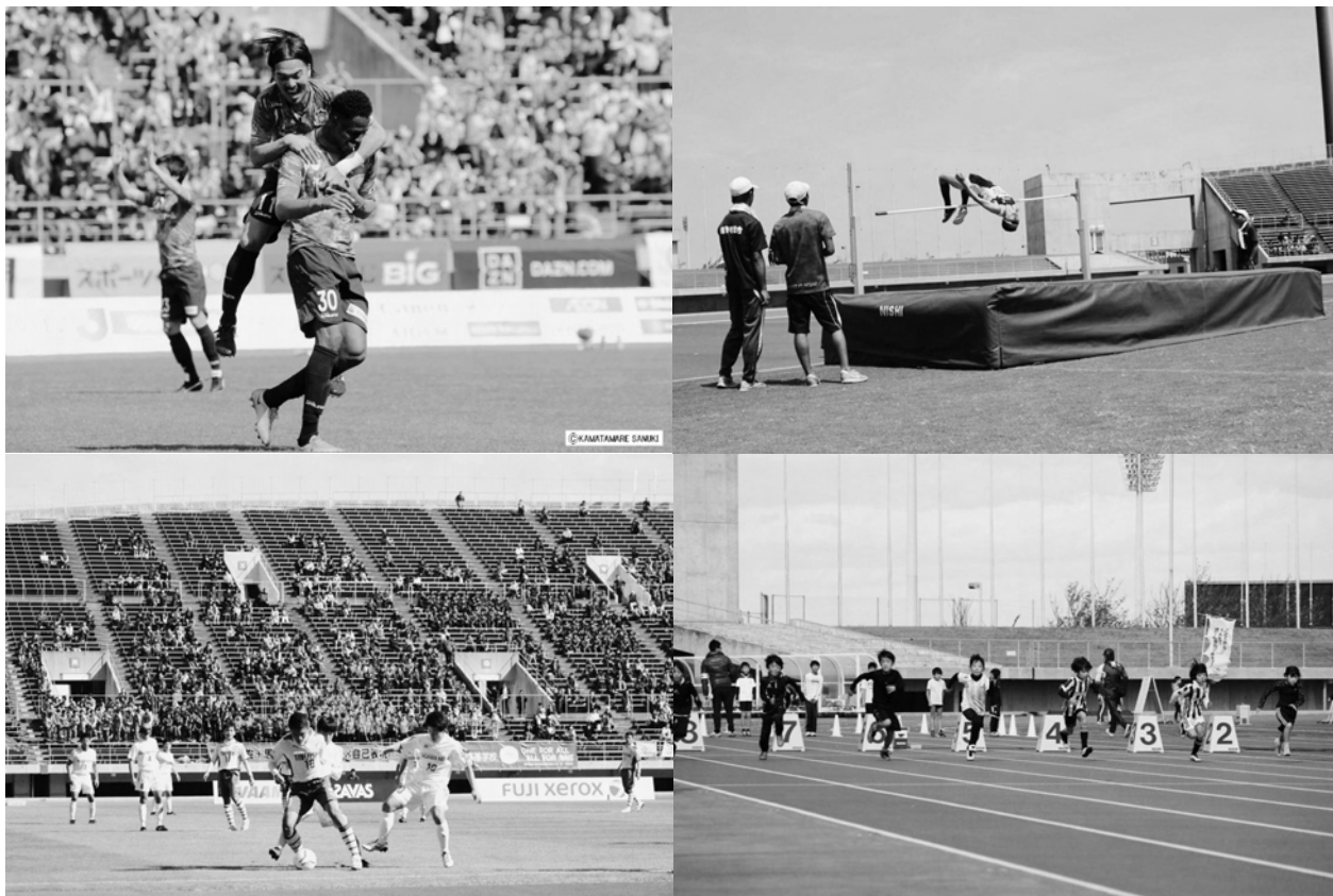
↑ 2017年に行われた大会など