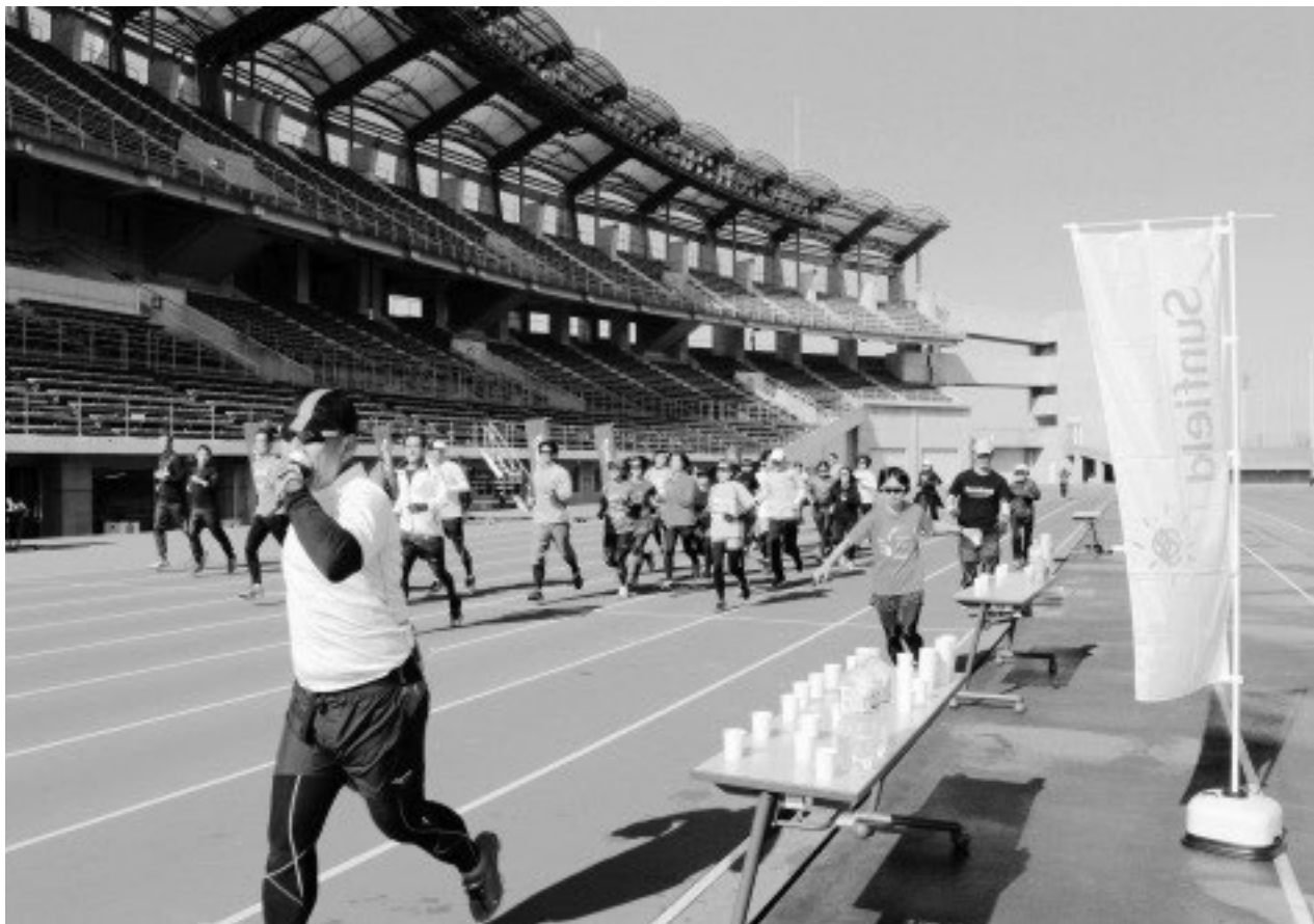
↑ 第73回丸亀国際ハーフマラソン攻略クリニック